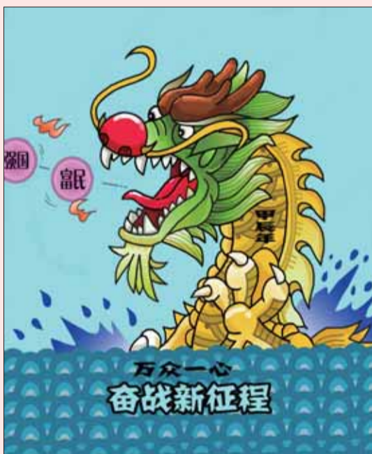
蛟龙得水显神威 ■王征