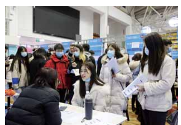
学校毕业生深受用人单位青睐，众多优秀企业争相来校招贤纳士。