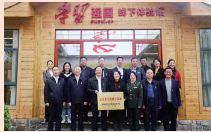
强化思政教育，筑牢“思想阵地”。

如今，湖南财经工业职业技术学院乘着党的二十大的强劲东风，瞄准中国特色高水平高职学校 and 升格为职业大学建设目标，踔厉奋发，勇毅前行！