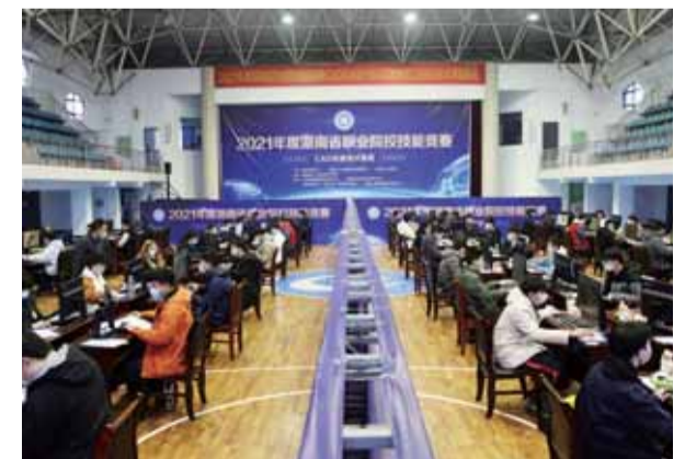
技能竞赛湖南财经工业职业技术学院赛场比赛现场。