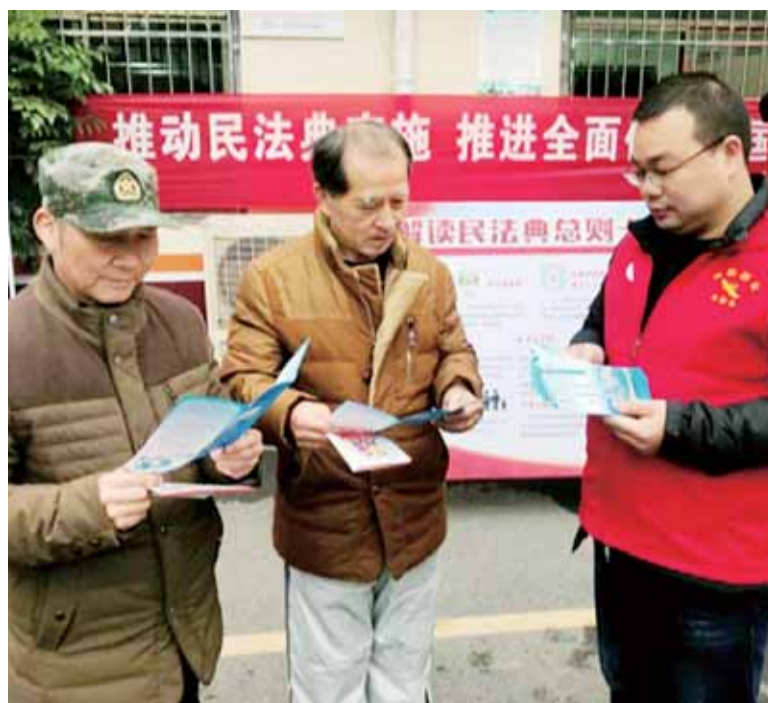
12月4日,市退役军人事务局、石鼓区民政局联合石鼓区青山街道西湖一村社区开展法制进社区宣传活动,志愿者用通俗易懂的语言、生动的案例向社区居民详细讲解了宪法、民法典、土地管理法等法律相关知识。

专家建议,近期气温偏低,需做好流行性疾病的预防工作,提醒公众注意防寒保暖;7—10日,天气相对平稳,雾霾将有所发展,尤其注意防范雾霾对人们生活的影响。