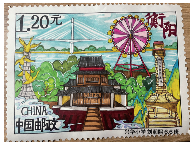
■ 蒸湘区兴华小学 六(6)班 刘润熙 作品介绍：这幅画以手绘的形式，展现衡阳名胜及地标建筑，勾勒出这座城市文化底蕴及城市特色，画笔中渗透着作者对衡阳的爱。石鼓千年韵自长，合江汇处墨流芳。