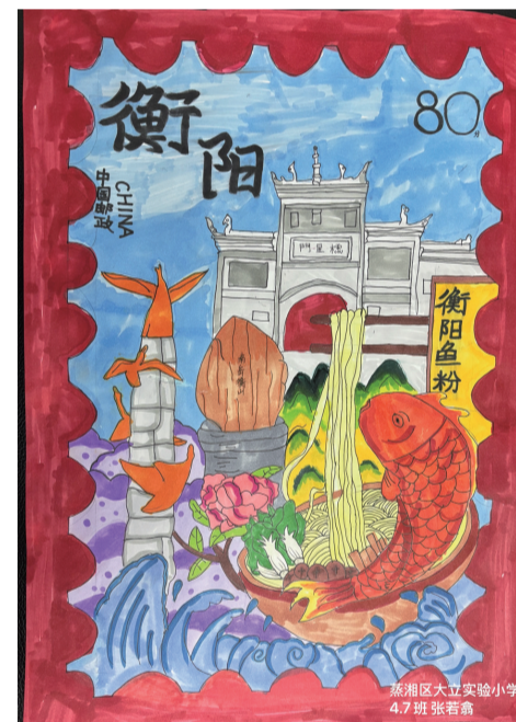
■ 蒸湘区大立实验小学 四(7)班 张若翕 作品介绍：彩笔绘衡阳邮票，鱼跃粉香间展雁城地标与特色美食。