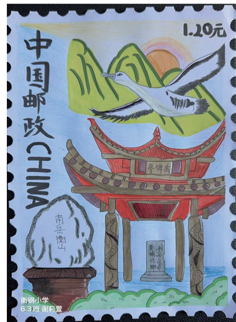
■ 蒸湘区衡钢小学 六(3)班 谢莉萱 作品介绍：这张手绘邮票展现出南岳衡山风光，大雁飞翔，禹碑亭与巨石相映，背景为青山骄阳，色彩鲜艳，中国风浓郁。