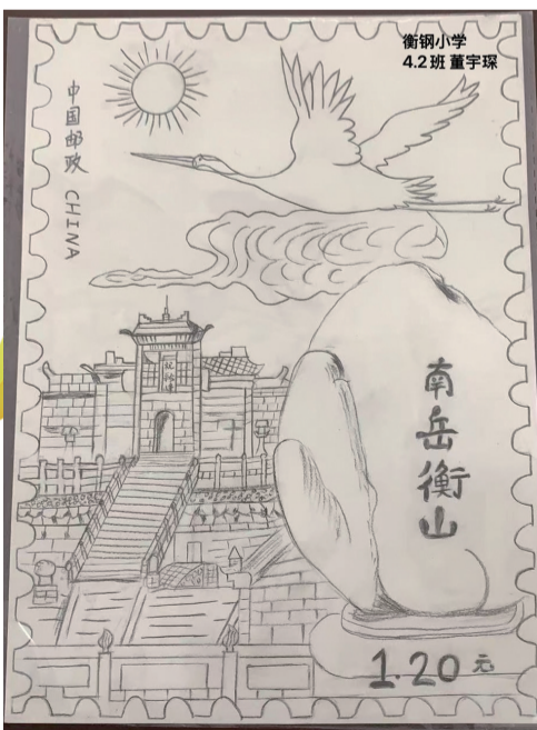
■ 蒸湘区衡钢小学 四(2)班 董宇琛 作品介绍：这枚邮票以南岳衡山为主题，融入衡山的古建筑与阶梯景观，加入太阳、祥云、飞鸟装饰，给画面增添灵动性与吉祥的寓意。