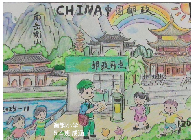
■ 蒸湘区衡钢小学 五(4)班 成涵 作品介绍：绘衡阳岳山之秀，融古建、邮政、童趣，山水间展地域风貌与生活暖意，色彩绚丽，满是生机。