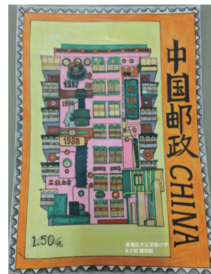
■ 蒸湘区大立实验小学 六(2)班 聂琮航 作品介绍：本作品将中国邮政与衡阳工业历史融合，以复古几何建筑为主题，用撞色搭配呈现时代印记，邮票式边框强化邮政主题，诠释邮政承载的城市记忆。