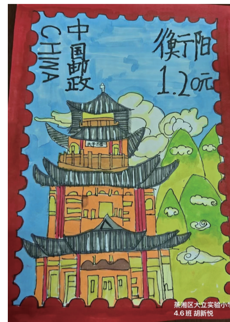
■ 蒸湘区大立实验小学 四(6)班 胡新悦 作品介绍：以衡阳特色建筑夫子楼为主体，背景搭配蓝天、白云、青山，营造出清新自然的氛围，展现衡阳的自然风光与人文建筑融合之美。