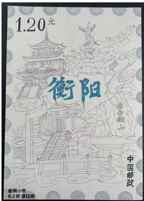
■ 蒸湘区衡钢小学 六(2)班 谭钰婷 作品介绍：画面包含衡阳特色建筑，展现衡阳的地域文化与标志性景观，体现衡阳的历史人文与自然风光。