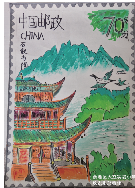
■ 蒸湘区大立实验小学 六(2)班 郑若菲 作品介绍：本作品聚焦衡阳石鼓书院这一文化地标，用青绿山水与古建筑勾勒湖湘文脉，借邮政载体传递书院的千年底蕴与地域文化之美。