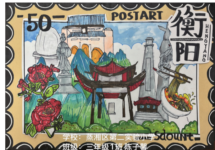
■ 蒸湘区第二实验小学 三(1)班 陈子馨 作品介绍：融合了衡阳的文化、建筑、美食与自然元素，展现衡阳特色。

衡阳日报社联合中国邮政集团有限公司衡阳市分公司举办的“小小邮票家 方寸绘雁城”《衡阳晚报》小记者手绘邮票大赛启动以来，面向全市《衡阳晚报》小记者征集作品，旨在通过邮票设计激发青少年的艺术创造力与爱国情怀。 参赛作品要求紧扣衡阳特色，可表现南岳衡山、石鼓书院等自然人文景观，或展现城市建设、产业发展新貌。作品征集截至2025年12月30日。本期选登部分优秀作品，欢迎小记者们踊跃投稿。