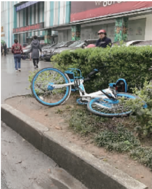
共享单车停进花坛,而边上就是共享停车位