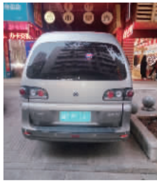
3月3日,一辆牌照为湘DM××41的面包车整天占用中山南路13号(惠馨宾馆)门前消防通道,紧临消防通道的是两个酒店及居民小区,若发生火灾,后果不堪设想!