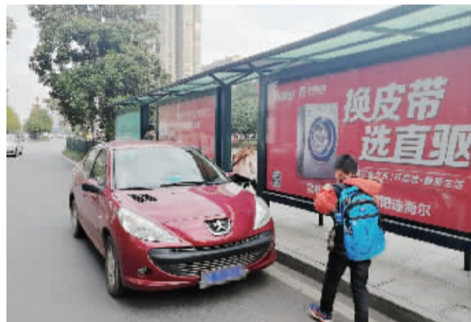
3月1日下午5点10分,市政府大门口左侧辅道,一辆红色标致小车(车牌号:湘D×××89)违章停在辅道上,为避免被监控拍到,司机故意将车停在公交站广告牌后,自己锁车办事去了。