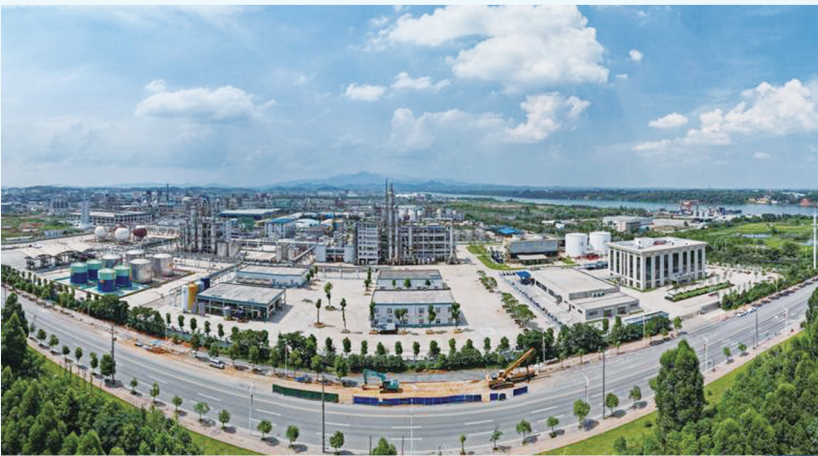
常宁市铜铅锌材料产业集群新晋“国家队”。（资料图片）