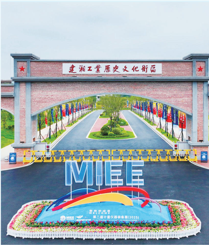
国家级计量盛会在衡成功举办。