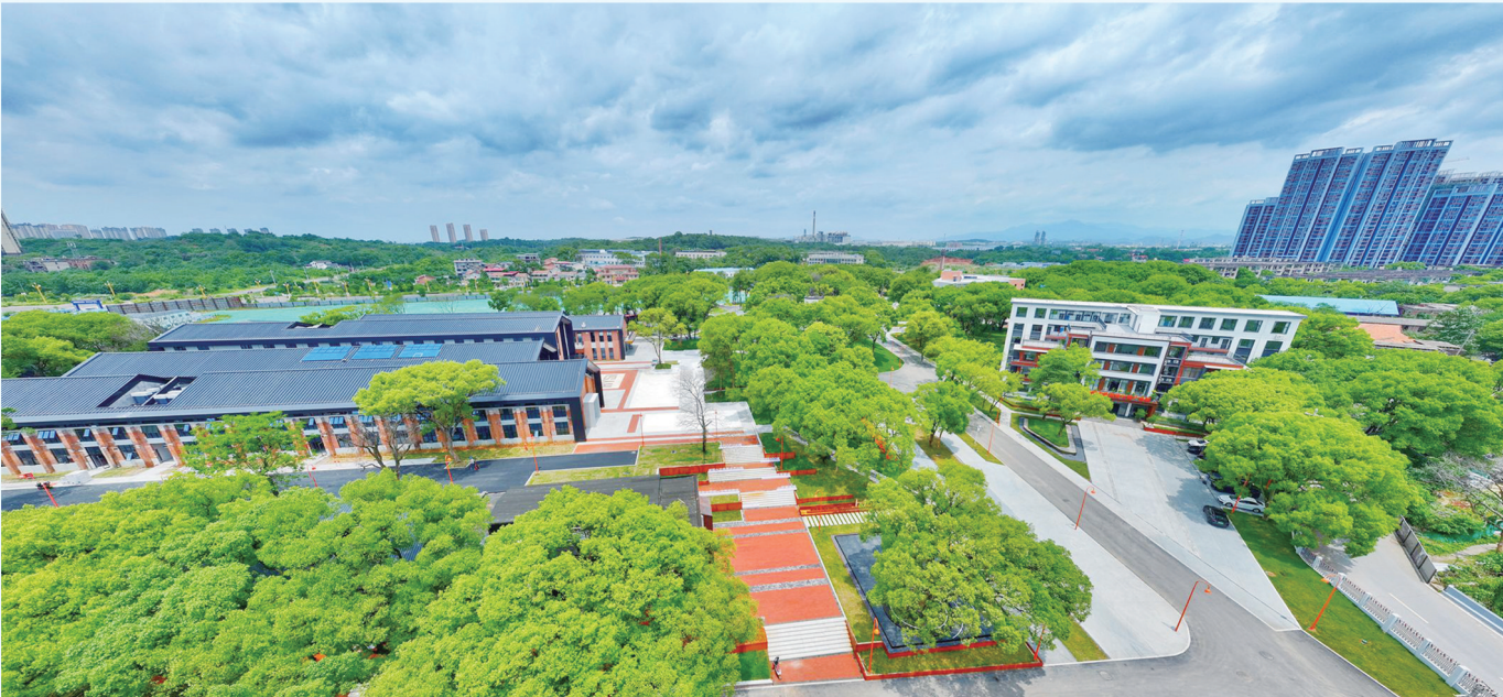
衡阳智能衡器计量产业园。