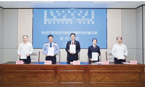
《知识产权司法行政协同保护合作备忘录》签署仪式现场。

近日,在第25个世界知识产权日到来之际,市中级人民法院联合多部门开展“凝聚协同合力共护知识产权”系列活动,以“三部曲”奏响知识产权保护最强音,为创新发展注入法治力量。