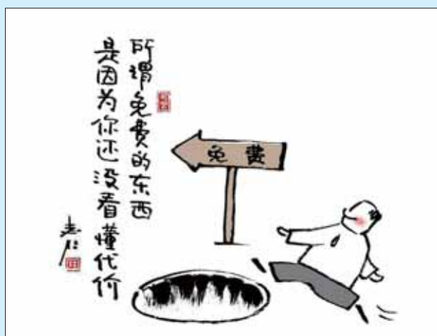
所谓免费的东西,是因为你还没看懂代价。 ■田志仁