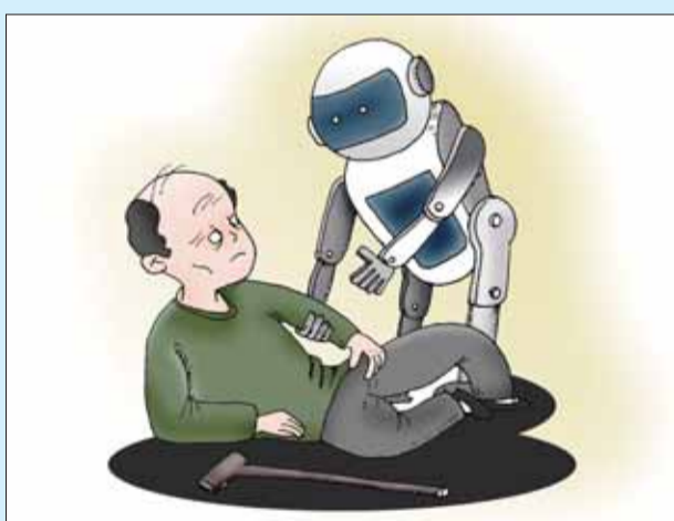
老人摔倒了 ■沈海涛