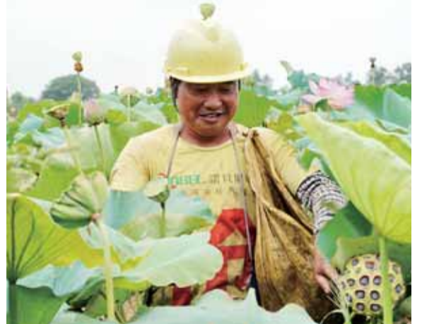
丰收的喜悦“写”在脸上。