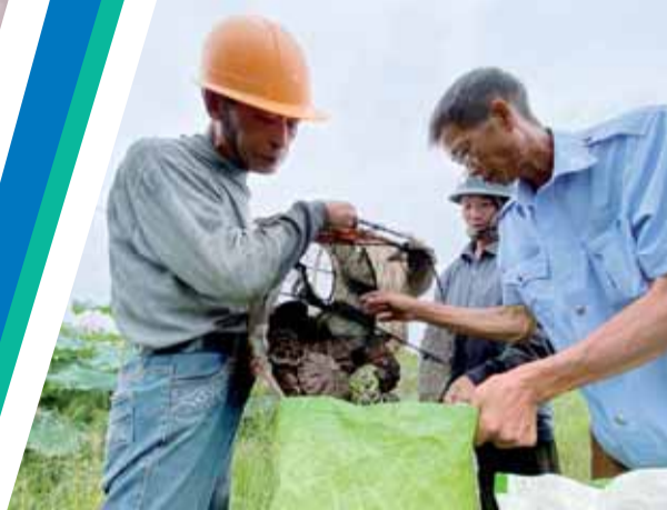
采摘完后将进行加工。

产业，共流转400余亩土地种植湘莲，让“荷花经济”带动村民增收致富，逐渐走出了一条具有地域特色的乡村振兴之路。