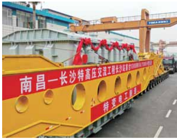
安稳坐在“轿子”上的“巨无霸”。

南昌—长沙特高压交流工程长沙站首台 1000MVA/1000kV 变压器成功发运