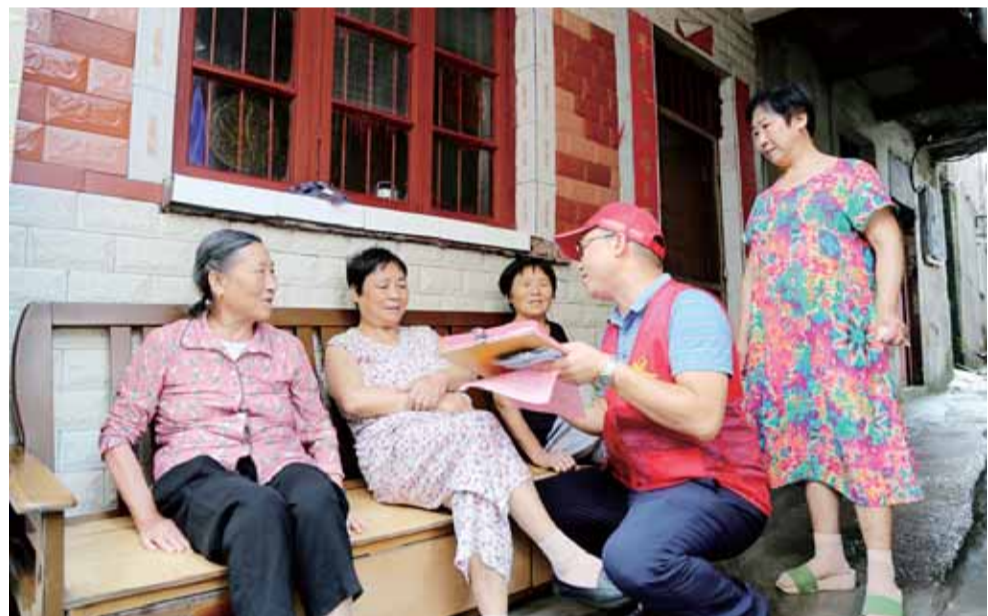
志愿者入户宣传创文创卫知识

本报讯(文/图 记者 胡建军 通讯员 唐兰荣)7月31日,珠晖区城管大队执法人员在东风路进行巡查时,除了督促商户们做到规范经营外,还提醒商户注意“门前三包”。清扫保洁员也正在对主次干道、广场绿化带、花坛内的白色垃圾进行全面清理,对果皮箱、