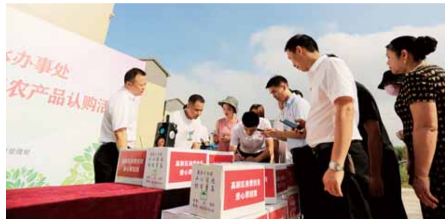
湘桂村认购现场,市民和单位抢购翠冠梨和巨峰葡萄

本报讯(文/敖文景 图/张志伟 实习生 周继晋)7月31日,高新区蒸水办事处开展“消费扶贫”活动,产自二塘、湘桂两村贫困户种植的特色翠冠梨、巨峰葡萄成为“抢手货”,当天共有190余人参与认购,卖出约4000斤。