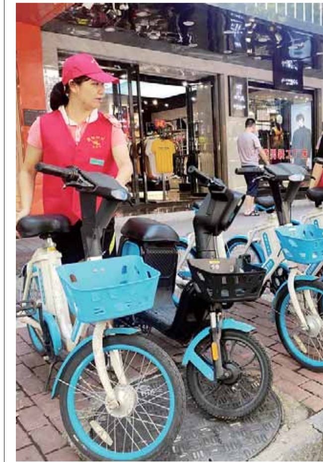
创文创卫活动开展以来,石鼓区人民街道向阳社区新时代文明实践站的“衡阳群众”志愿者经常放弃休息时间,在社区所辖的几个非机动车停放点巡查。除将乱停乱放的车辆摆放整齐外,还劝导一些不自觉的存车者合理摆放。图为近日该社区新时代文明实践站的“衡阳群众”志愿者整齐摆放共享单车。

此外,珠晖区还扎实开展“雁阵行动”,组织执法人员对各类违法违规行为进行文明劝导,并沿街宣传“门前三包”内容,采取一对一入户方式,与临街门店签订《“门前三包”承诺书》,让珠晖市民主动参与到城市管理中来,认真履行好“门前三包”责任制。截至目前,共计文明劝导1000余次,签订“承诺书”3500余份。