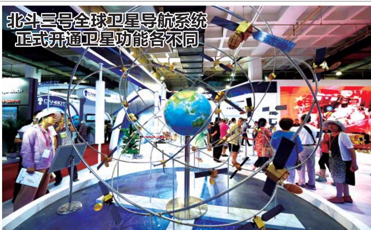
图为2017年6月9日，参观者在第二届中国北京国际科技产业博览会上参观展出的北斗卫星导航系统模型。