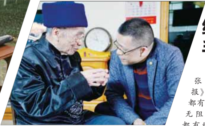
辗转奔波，求证“船山思想地图”