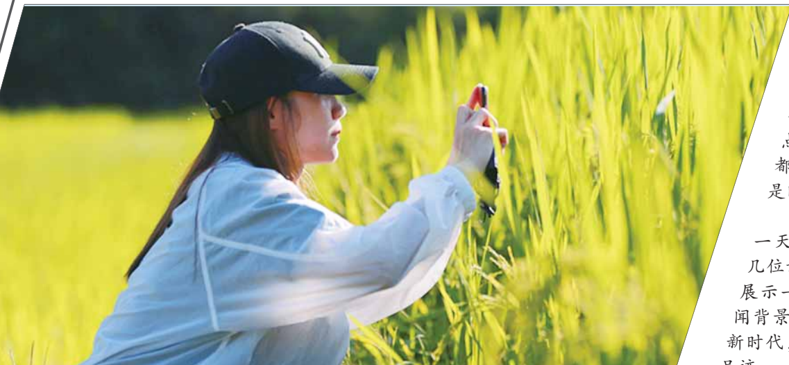
他们的足迹遍布广袤农村

今天，在记者节这一天，我们希望透过这几位记者的身影，向读者展示一些不同寻常的“新闻背景”，展示衡阳人奋进新时代，谱写衡阳梦的深深足迹。