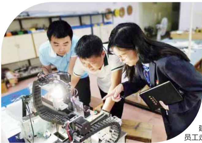
建行耒阳支行员工走访辖内企业

本报讯(文/图 通讯员 屈建新)近日，衡阳银保监局组织召开银行业金融机构“百行进万企”融资对接工作动员会议。建行衡阳分行高度重视，制定对接实施方案，召开专题部署会议，全面启动“百行进万企”融资对接工作。