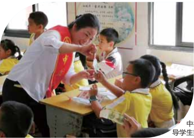
中行员工指导小学生辨认钞票

本报讯(文/图 通讯员 陈云)“妈妈，妈妈，我会辨认假钞了！中国银行的阿姨教我们的。”9月5日下午，环城南路小学门口，一位小学生开心地告诉前来接她的妈妈。