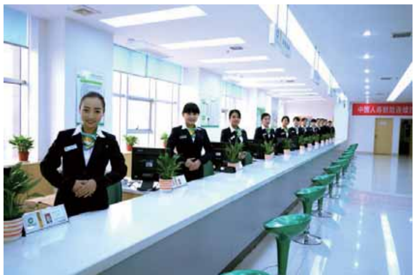
窗明几净的服务大厅

客户服务中心现有窗口服务人员34人，中心设置承保类窗口4个，理赔类窗口9个，严格执行公司“365+”客户服务承诺。