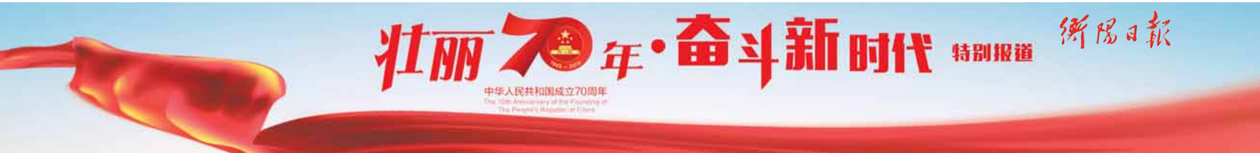
责编/伍施施 校对/陈爱晖 版式/许宏亮