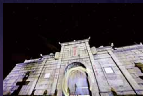
站在祝融之巅,伸手仿佛可摘下星辰