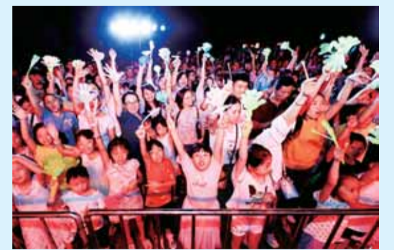
现场观众齐声同唱《我爱你中国》