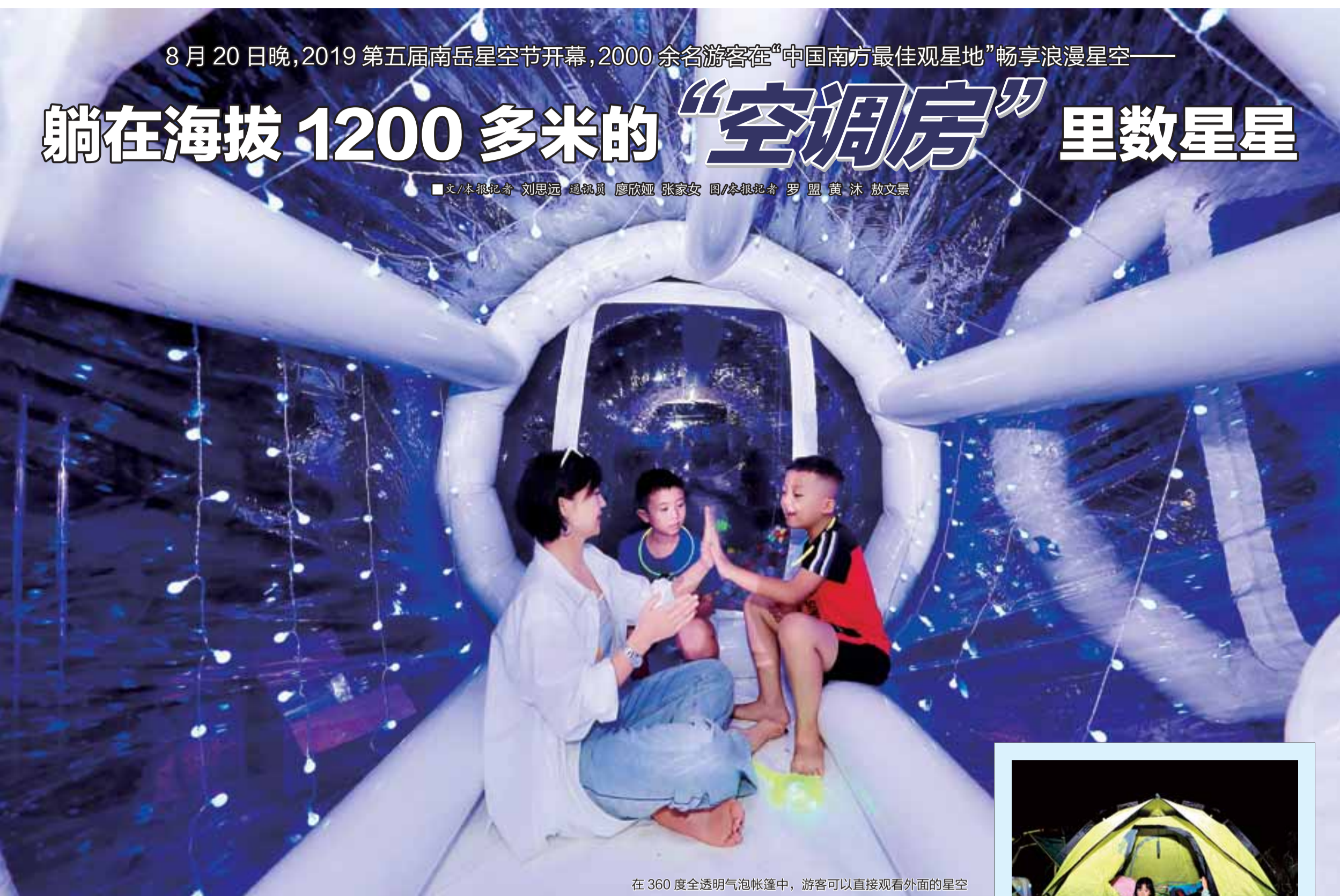
在360度全透明气泡帐篷中,游客可以直接观看外面的星空

■文/本报记者 刘思远 通讯员 廖欣娅 张家女