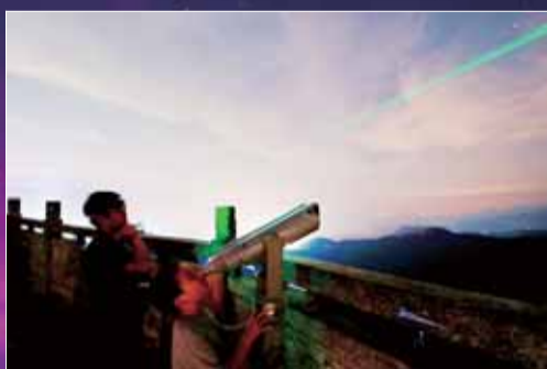
天文爱好者探索星空的奥秘