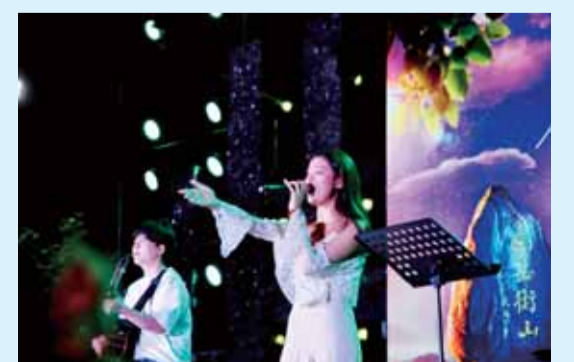
余声乐队带来热门歌曲《讲真的》