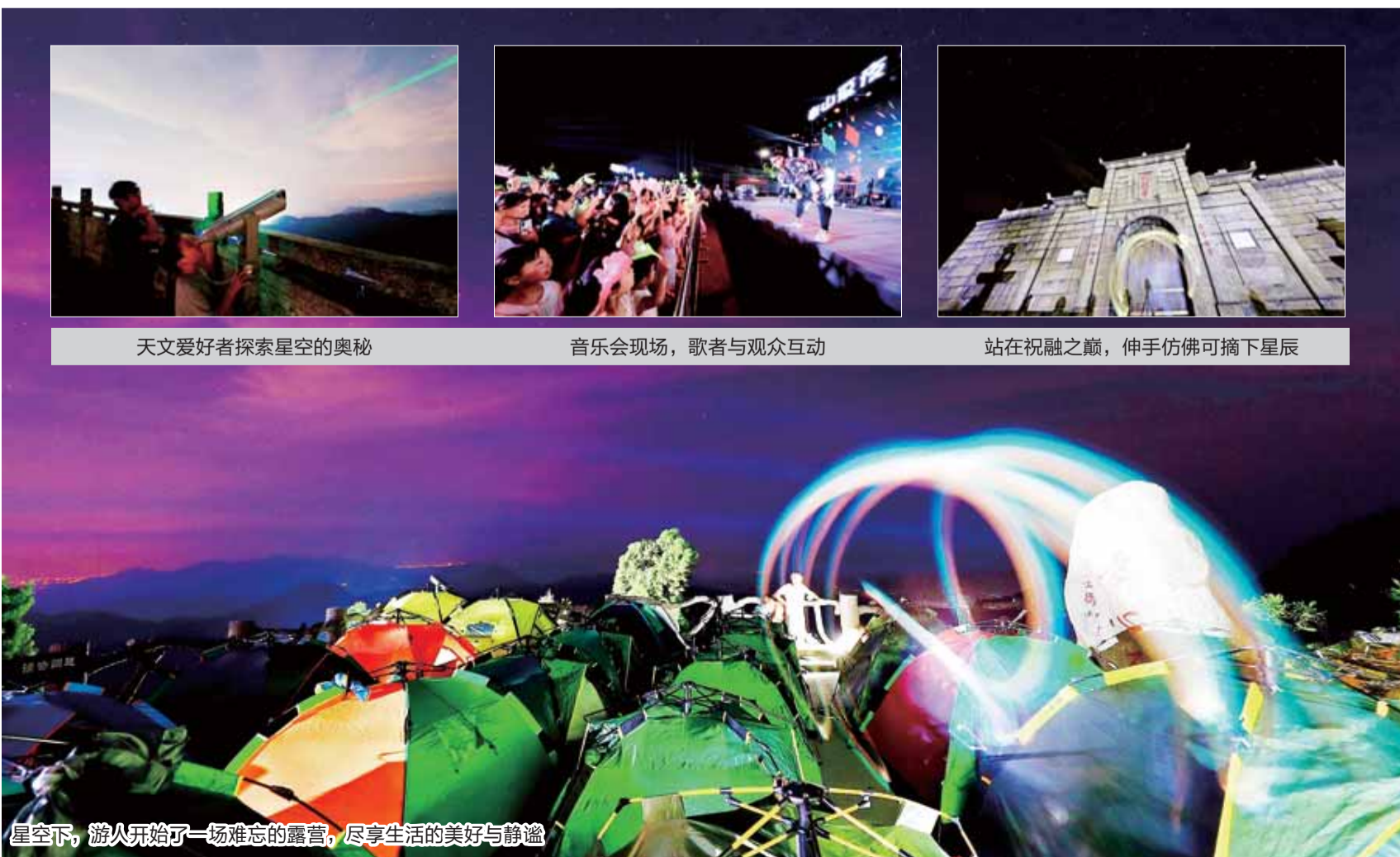
星空下,游人开始了一场难忘的露营,尽享生活的美好与静谧