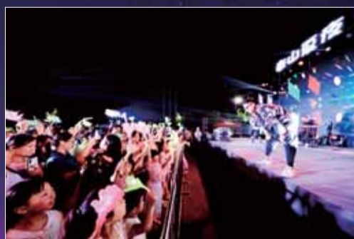
音乐会现场,歌者与观众互动