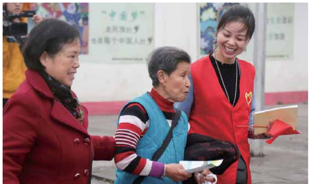
在大庆路口，志愿者扶老奶奶过马路

今年9月举办的“2018衡州经济发展论坛”完成市、县（区）两级共签约项目82个，总投资额、总引资额分别达到907.62亿元、820.12亿元，其中500强战略项目12个，在签约项目数量、质量、投资额度、产业拉动作用方面实现了全新突破。