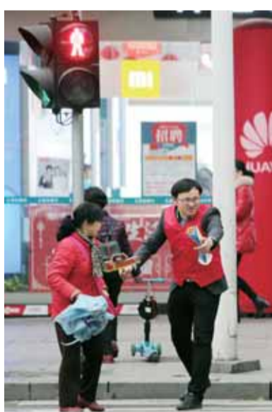
志愿者劝导欲闯红灯的市民