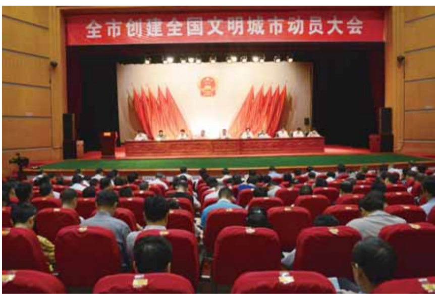
5月9日召开创建文明城市推进大会

在创建全国文明城市过程中，全市上下一心高扬主旋律，传播正能量，推动城市发展更有质量、城市更有温度、市民更加幸福，共绘“环境美、好市容、生活好”的美好画卷。