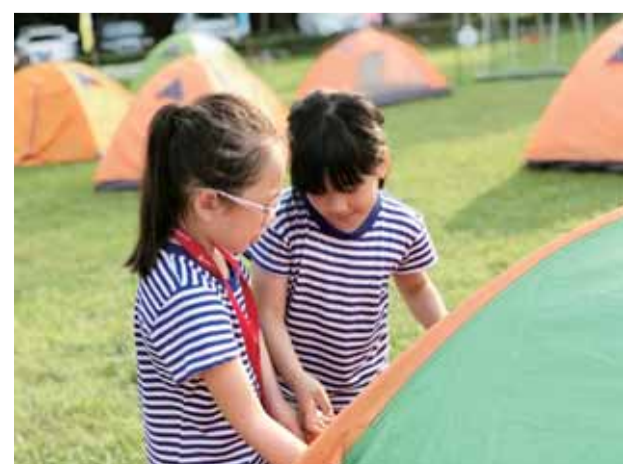
搭好帐篷，准备露营