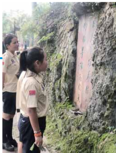
欣赏峨眉碑林书法