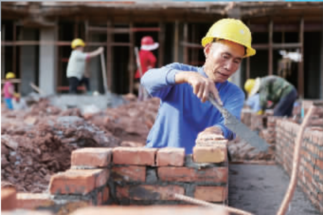
新桥安置房建设进展迅速，工人正在加紧作业