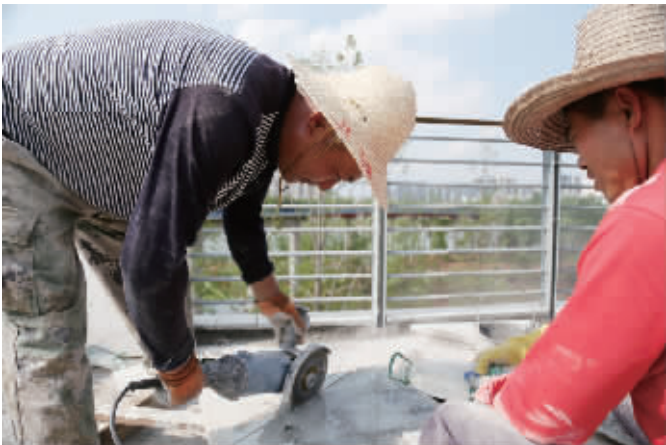
工人们正在对风光带进行道板砖铺设