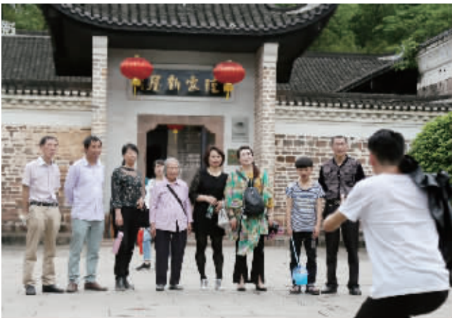
一家人在陆家新屋合影

经过提质改造后的陆家新屋成为名副其实的城市“后花园”，假期携老带幼在这里游玩休憩几乎成了不少家庭的“标配”。 “五一”假期，恰逢黄色的三色堇盛开正艳，景区迎来大量游客——古建筑进出的人流不曾间断；游玩区的小溪尤其受欢迎，小孩在这里玩水抓小虾，好不热闹。