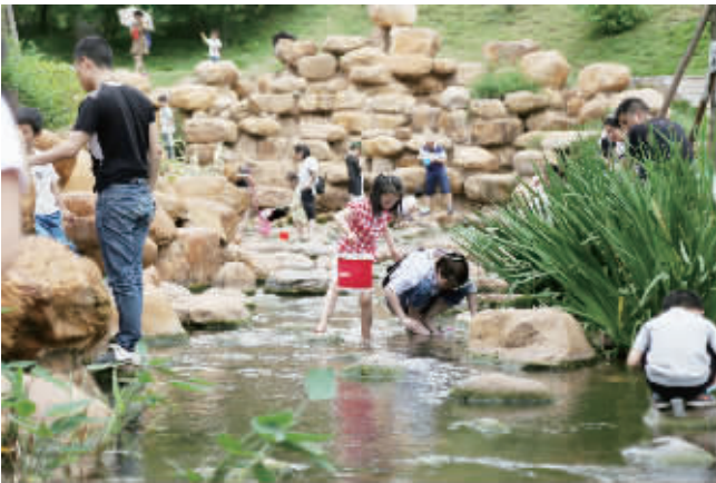
陆家新屋的小溪让很多城市孩子体验到乡野之趣

经过提质改造后的陆家新屋成为名副其实的城市“后花园”，假期携老带幼在这里游玩休憩几乎成了不少家庭的“标配”。 “五一”假期，恰逢黄色的三色堇盛开正艳，景区迎来大量游客——古建筑进出的人流不曾间断；游玩区的小溪尤其受欢迎，小孩在这里玩水抓小虾，好不热闹。