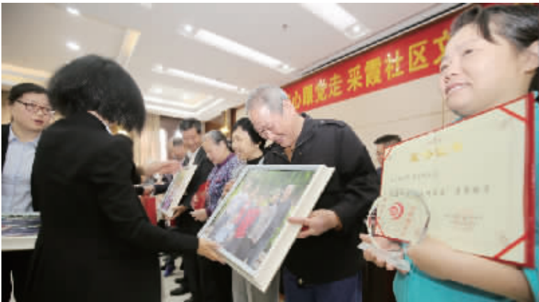
通过文明家庭的评选传递良好家风

本报讯（文 / 图 通讯员 李西）4 月 27 日，高岭办事处采霞社区举办“不忘初心跟党走——‘文明家庭’评选表彰会”，对 13 户文明家庭进行表彰。 采霞社区此次“文明家庭”评选，由工作人员通过深入各小区，听取群众意见，上门了解情况进行登记，按照申报、评选、审核、公示、表彰的程序进行，活动以“夫妻和睦”“尊老爱幼”“教子有方”“爱岗敬业”“诚实守信”“热心公益”等为标准，最终评选出 13 户“文明家庭”。 高岭办事处相关负责人表示，这次评选出来的 13 户代表，都是来自基层的普通家庭，他们以自己的模范行为，同家庭成员一起，弘扬和践行社会主义核心价值观，温暖了人心，诠释了文明，传播了正能量，树立了榜样，值得表彰。希望在今后，大家能够用社会主义核心价值观引领家庭文明建设，注重家庭、注重家教、注重家风，使千千万万个家庭成为国家发展、民族进步、社会和谐的重要基点，成为人们梦想启航的地方，为实现中华民族伟大复兴的“中国梦”贡献自己的一份力量。