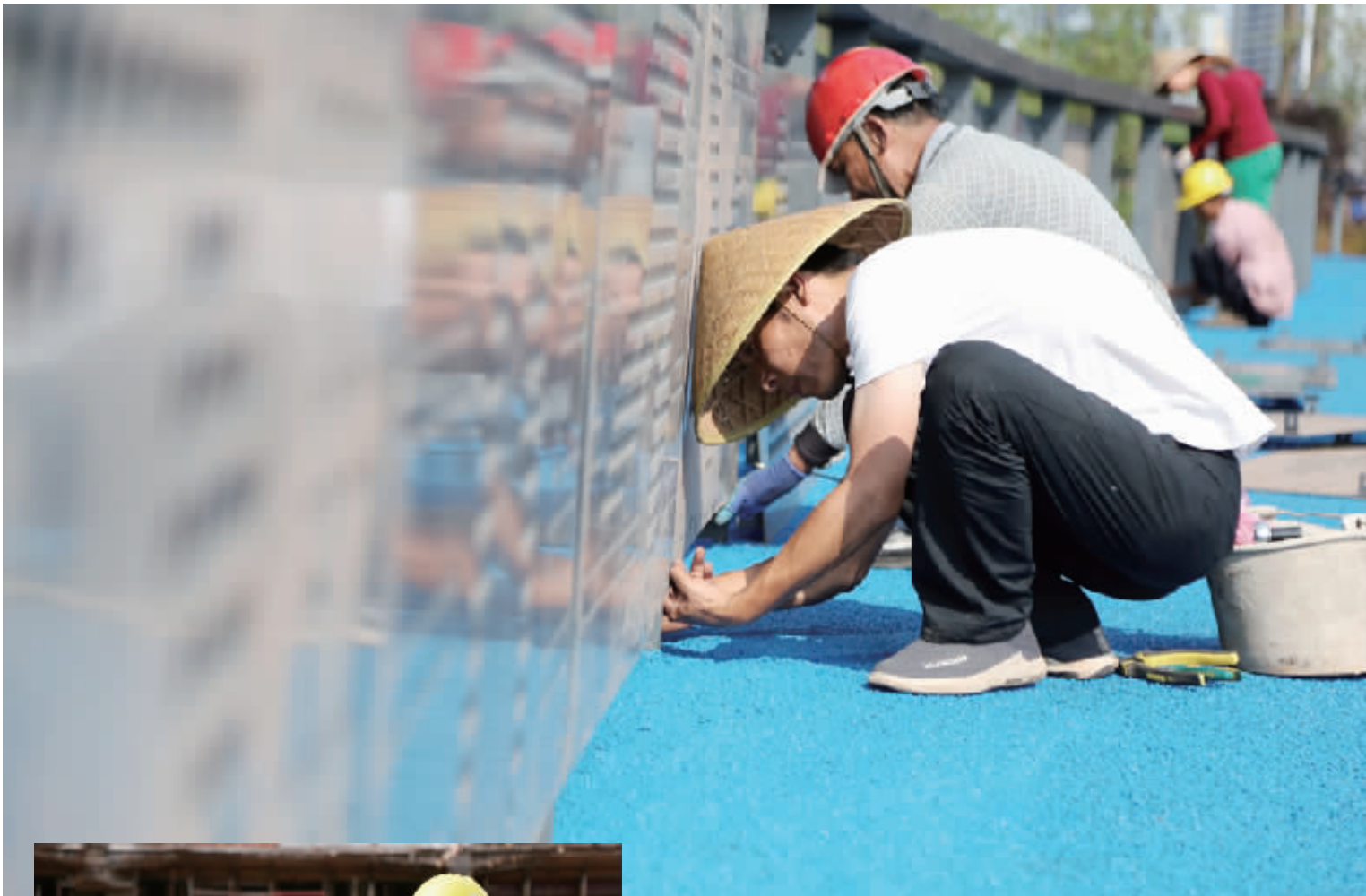
雁鸣溪风光带走廊围挡装饰正在加快进行