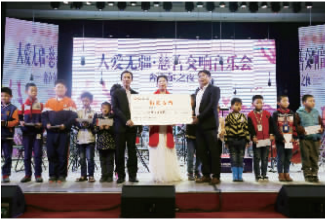
爱心企业奔立尔与衡州交响乐团通过音乐会的形式呼吁爱心的力量

本报讯（文 / 记者 唐欧）4 月 26 日晚，“大爱无疆 慈善交响音乐会——奔立尔之夜”在高新区衡州小学多功能剧场温馨上演。将企业爱心与音乐会结合，高新区以创新之举为慈善事业加油鼓劲。据悉，当晚奔立尔教育集团共为近 130 名贫困学子捐赠校服和爱心款。 在市慈善总会的指导下，此次活动由高新区教文体局和奔立尔联合主办。据悉，奔立尔是一家以教育产业为主导，涉及设计研发、生产、销售、服务为一体的集团化企业，经营项目涵盖服装、文体用品、国际交流、教育培训、技能人才培养、电教设备、教育软件应用等系列。 当晚，爱心企业奔立尔现场为高新区内 18 名贫困学生捐赠爱心款 15000 元，为高新区对口援助学校——祁东县双桥镇兰古小学 108 名学生无偿捐赠 216 套校服。为表谢意，兰古小学还向奔立尔送上了“大德高义 百世馨香”的锦旗。