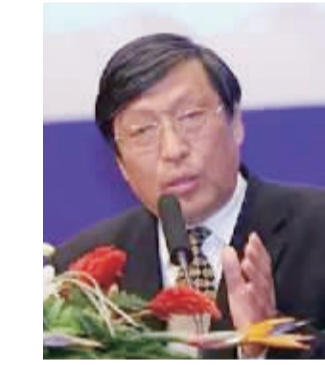
——常修泽 中国宏观经济研究院教授

自然环境和生态环境保护领域的“大部制改革”发展方向是明确的，那就是整合、调整相关部门职能，尤其是将过去几年里形成的部门间有效协作关系以“制度化”的形式固定下来，尽可能地有关自然资源和生态环境保护的职能集中起来，这也正是开展环保机构改革的重要价值所在。总体而言，自然环境和生态环境保护领域的“大部制改革”不仅可以使大部制的机构设置更好地适应生态环境保护工作，同时也可以更好地与社会主义市场经济体系相兼容。