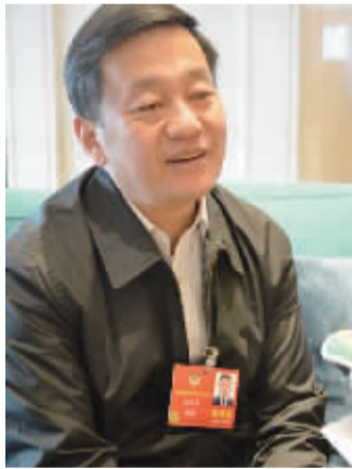
——徐达波 全国政协委员

随着新技术革命的深化，“人力资本”的价值和作用，将超过“物力资本”，而成为人类的“第一资本”。“人力资本”在哪里，在我们千千万万个技术创新者、知识创新者和管理创新者身上。再有，绿色发展也要用“人”来串。从人的角度看，一方面，“绿水青山就是金山银山”，但另一方面，从人的自身发展来说，“绿水青山”也是保障“人的环境权利”的一个重要方面。