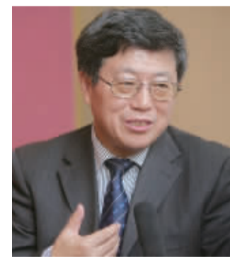
——迟福林 全国政协委员

我国拥有世界上规模最大的劳动力资源，这是创新发展的最大“富矿”。要提供全方位创新创业服务，推进“双创”示范基地建设，鼓励大企业、高校和科研院所开放创新资源，发展平台经济、共享经济，形成线上线下结合、产学研用协同、大中小企业融合的创新创业格局。