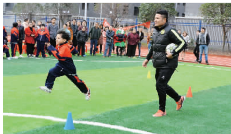
近日,雁峰区白沙实验学校举行“阳光运动,七彩童年”亲子运动会暨元旦活动,通过表彰优秀家长与文明班级、教师广播体操展示、学生广播体操比赛、足球亲子运动会等形式,全面展示学校师生朝气蓬勃、拼搏向上的精神风貌。

期间,工作坊团队精心研制培训方案,前瞻性地确立了“践行学生为本,培育核心素养”“高中数学教学实践渗透创客文化”两个研修主题,通过自主研修、同伴互助、主持人引领与专家指导相结合以及集中会课、专题讨论、行动研究与成果展演等多种形式,为学员们职业与专业素养的成长提供了一个坚实有力的学习平台。为了保证C410研修的高质量,工作坊团队除了坊主授课以外,还特意聘请了省内高校专家或一线名师前来讲学,专家们开阔的视野和深刻的见解,让每一位学员受益匪浅。