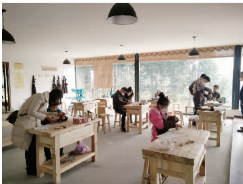
随着《中小学综合实践活动课程指导纲要》的下发,综合实践活动成为义务教育和普通高中课程方案规定的必修课程。我市各中小学校也鼓励学生多参与各类实践活动,开阔视野,提高动手能力。图为元旦假期,一些学生在家长的带领下去木作加工坊体验木艺手工制作。

一年来,全市17所省、市级示范幼儿园与68所为民办实事项目园、社区和农村薄弱幼儿园开展了结对帮扶;石鼓区人民路小学与新疆鄯善县台尔小学、衡东杨林完小、衡阳市西湖小学结成了“牵手真好”结对帮扶学校;衡山县实验小学一学期挑选12名骨干教师每周定时到永和完小送课……各优质校主要从教育理念、学校管理、师资力量、教学资源、办学条件等对帮扶校进行全方位融合,推动优质教育资源共享,整体提升了薄弱学校办学水平。