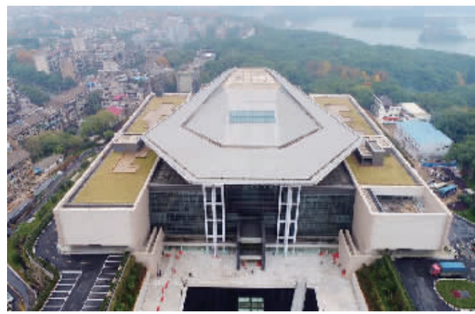
11月28日，从空中俯瞰改扩建后的省博物馆气势恢弘，主体建筑设计时尚大方。