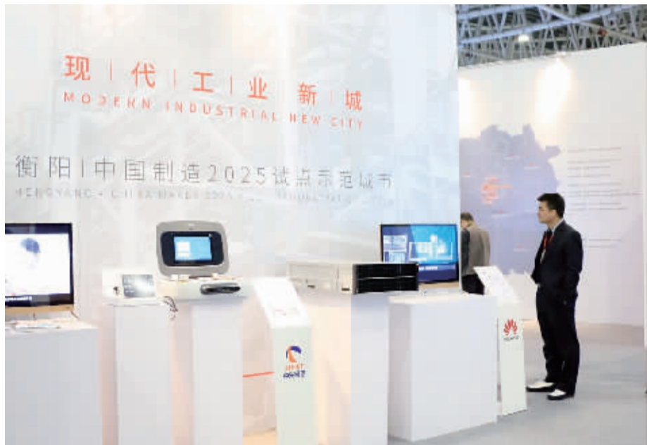
华为(衡阳)联合创新实验室驱动高新区产业升级