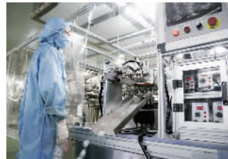
企业知识产权工作力度加大,发展更显活力