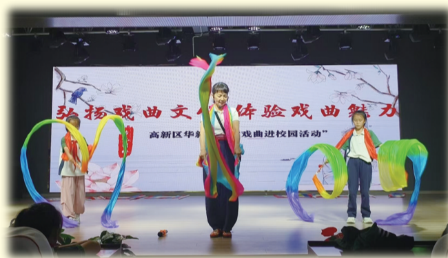
三尺长绸,凌空舒展。