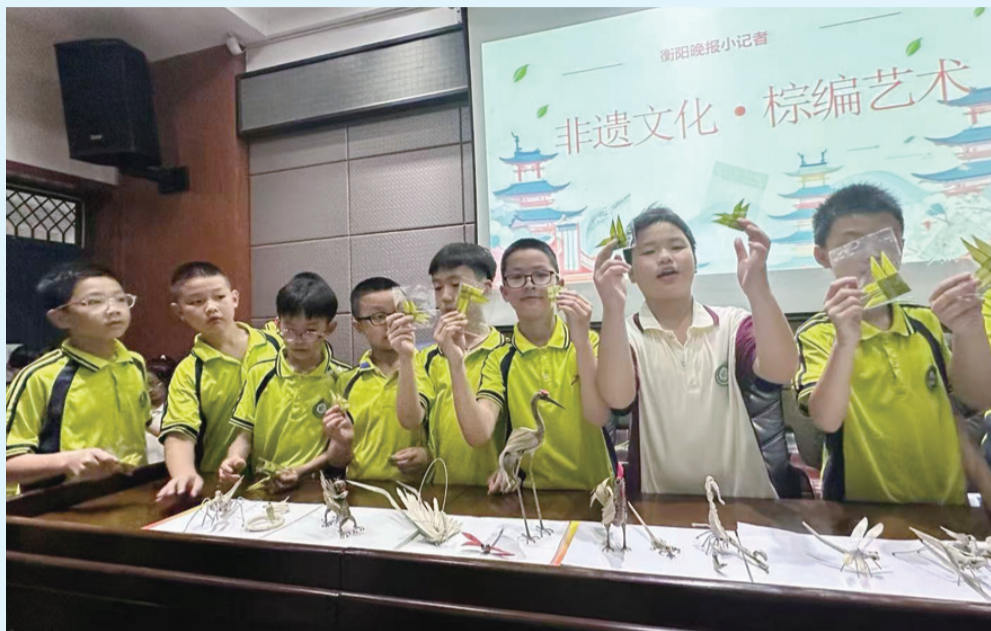
学以致用,传承中华文化瑰宝。