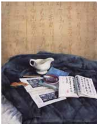
有字帖的静物 106cm×76cm 1995年6月

叶经文既吸收中国水墨画的养分,又吸纳油画的厚重质感,在融入特定的审美情趣之后,力求表达意象水彩新语境。意象水彩新语境从“意”的抒发来驾驭“形”,既有“灵、透、韵、秀”等水彩语言特质传承,更有“物融于心”的独特感受。这种“不似之似”“似与不似之间”的意外之象,散发出强大的艺术生命力。