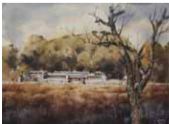
曾国藩故居 106cm×76cm 2021年9月