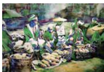
瑶乡早市 106cm×76cm 2003年7月