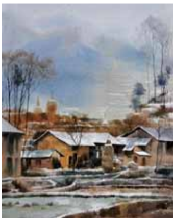
乡村初雪 76cm×53cm 2010年12月