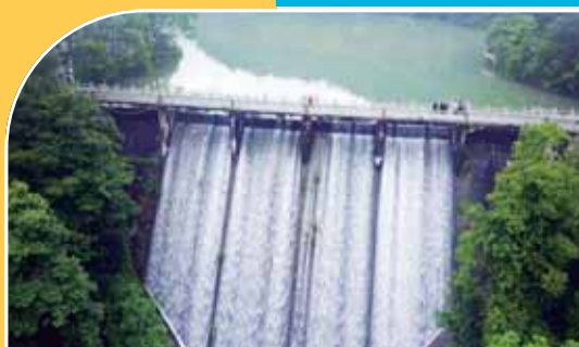
游人在华严湖大坝上观景