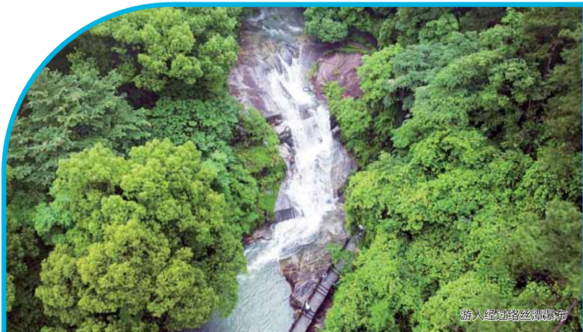
游人经过络丝潭瀑布

据权威机构检测,梵音谷每立方厘米空气中负氧离子含量高达108600个,有“天然氧吧”之称。为了充分体验、享受“氧浴”,享受自然健康旅游,不少游人都喜徒步游览此人间仙境。