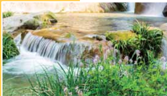
水质清冽 芳草鲜美