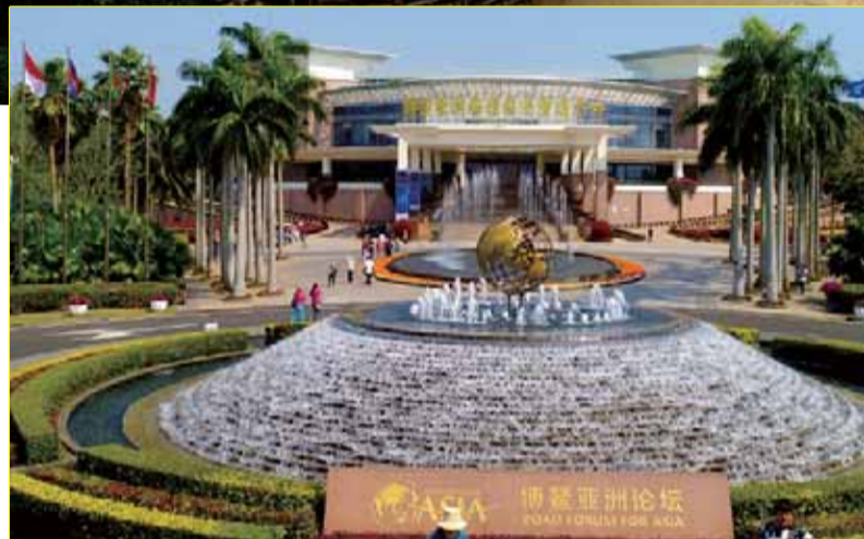
博鳌亚洲论坛国际会议中心

多边贸易体制受到冲击，世界经济向何处去？亚洲各国如何应对挑战、实现更好发展？面对不确定性，中国给出了什么方案？