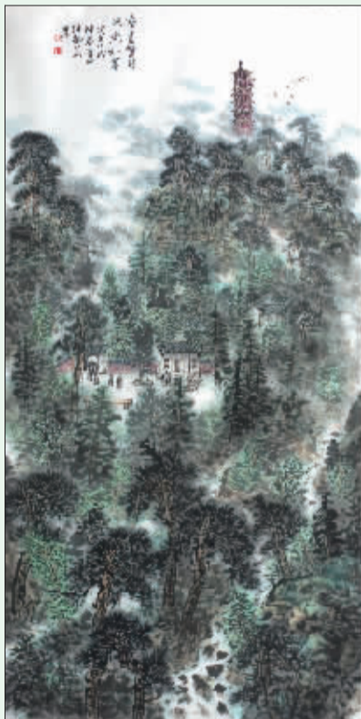
南台览胜风光如画