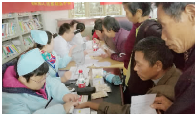
专家走进黄江村开展义诊活动