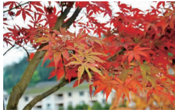
秋日山间里树叶变色