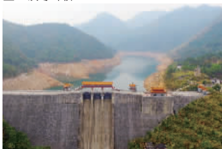
空中俯瞰城坪冲水库