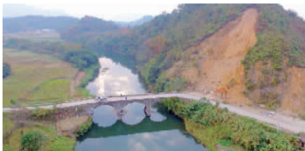
通往山村的路沿途美不胜收