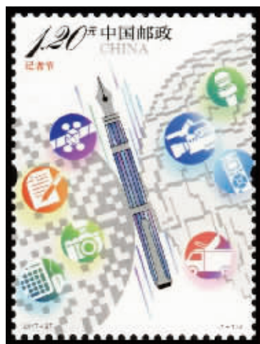
我国首次发行记者节纪念邮票