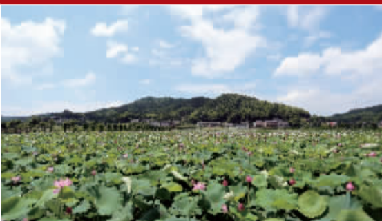
永济镇千亩荷花竞相绽放