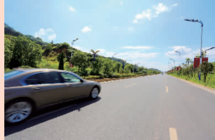
通往武广新城的宽阔道路