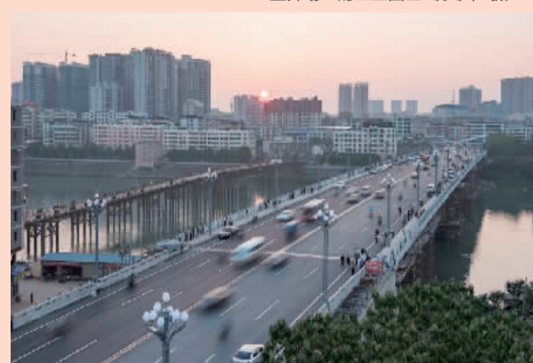
新耒阳大桥贯通方便两岸居民出行