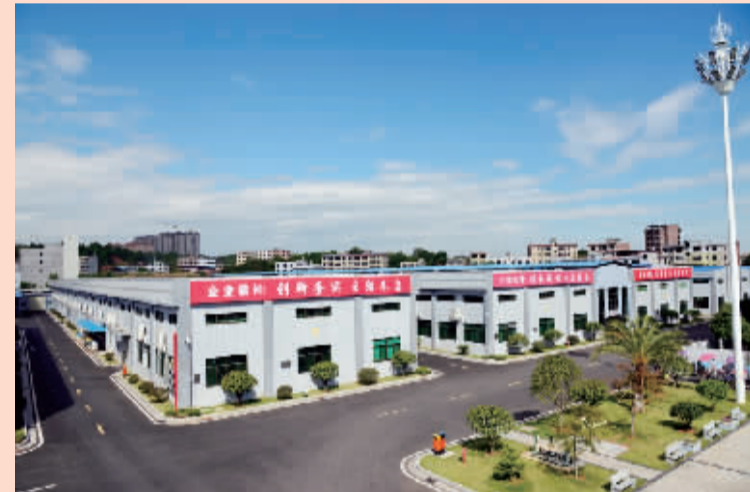
整齐划一的工业园区