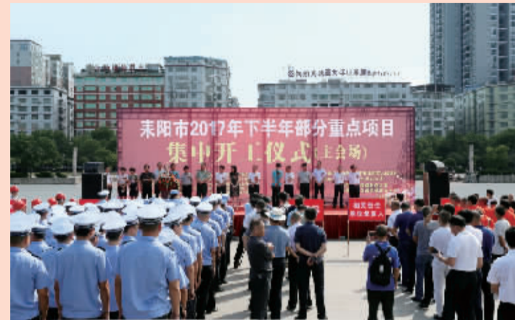
重点项目集中开工助推经济发展

昨夜斗回北,今朝岁起东。在这充满艰辛的五年,耒阳在困难中奋进,凝聚了力量,书写了精彩;站在新的历史起点,耒阳人必将在新的征程上描绘出更加精彩的“蓝图”。