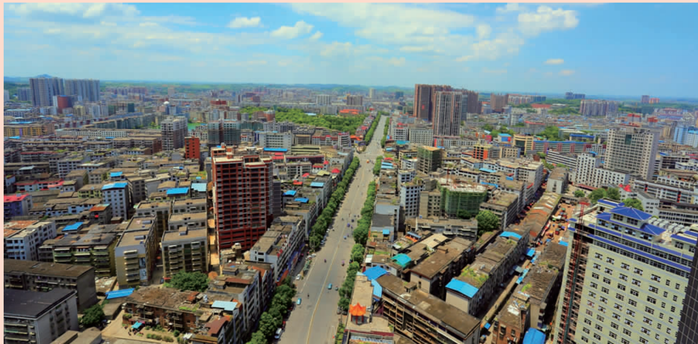
耒阳城区街道俯瞰