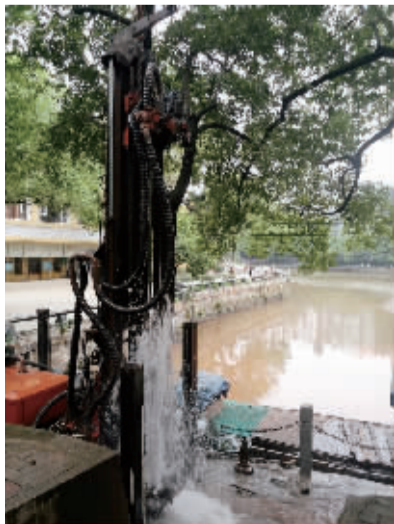
地下井水喷涌而出。

施工方透露,近期将在云水湖畔连续作业,打3口深水井,3口水井每小时合计出水量达100立方以上,井水冬暖夏凉,除了天降雨水,井水可作为天然优质水体资源,还云水湖清澈透亮。