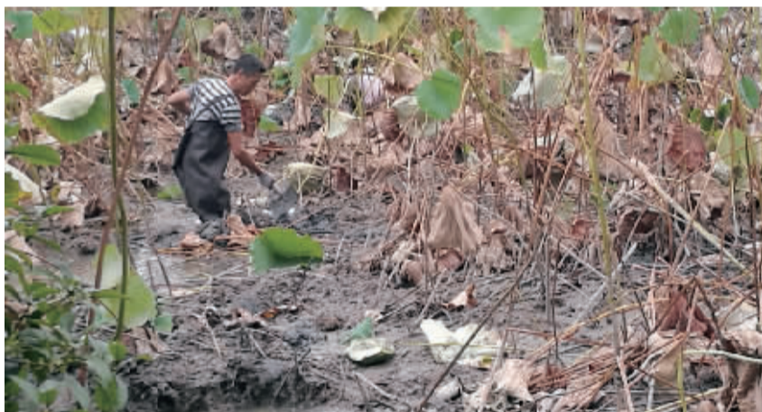
挥动铁铲,翻掀淤泥。