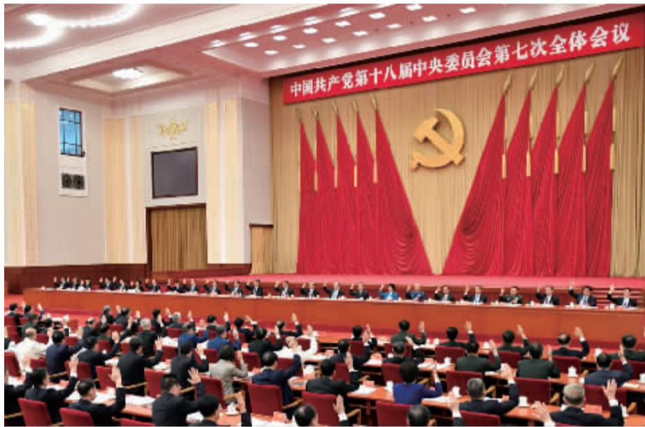
中国共产党第十八届中央委员会第七次全体会议,于2017年10月11日至14日在北京举行。中央政治局主持会议。