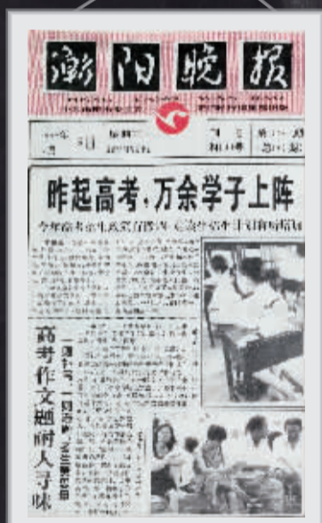
1998年的《衡阳晚报》,头版头条刊发高考报道。