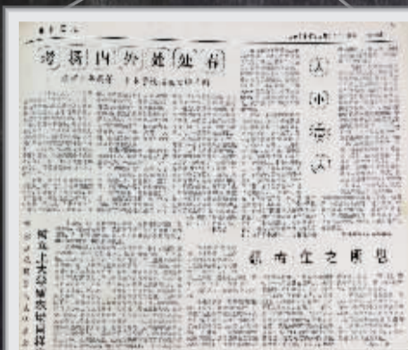
1977年的《衡阳日报》,已经对考场内外的新闻报道给予了关注。