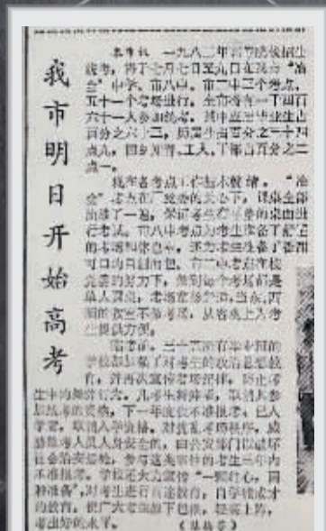
1982.7.6的《衡阳日报》,高考报道登上一版,不过只是“豆腐块”大小。