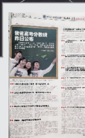
2015年的《衡阳晚报》,随着高考改革的深入,每年高考的报道,也成了媒体关注的焦点