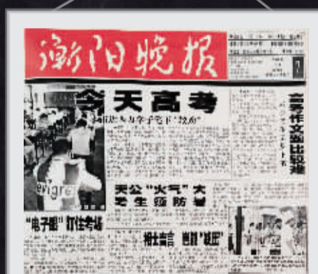
2000年的《衡阳晚报》,报道了“电子眼”首次出现在我市考场。