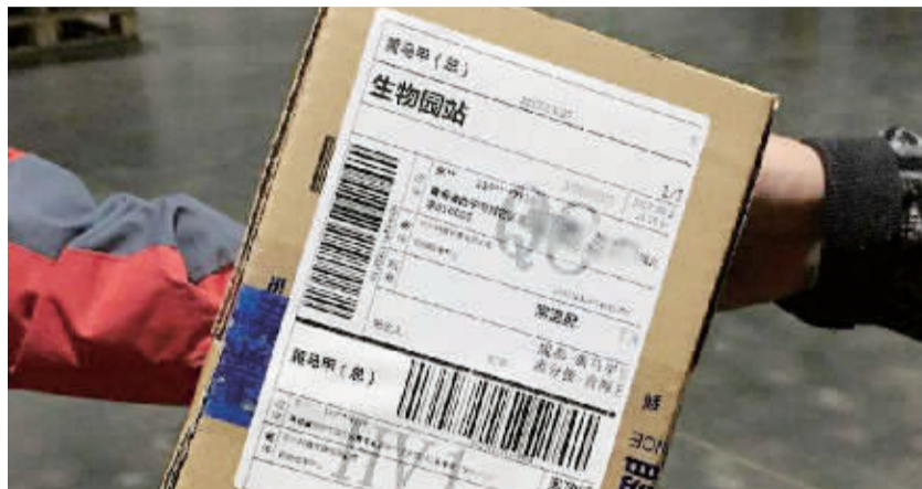
隐去了姓名、电话中部分信息的“隐私面单”(资料图)

将采用隐私保护技术,消费者的个人隐私信息在电子面单上被加密处理,电话号码只有快递员能通过APP联系到收件人