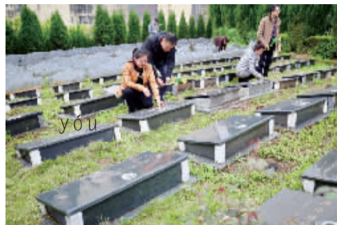
截至2016年底,我市已有200余名逝者入土草坪葬