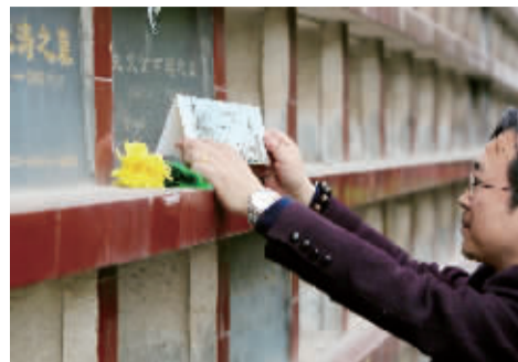
越来越多的市民自觉选择节俭低碳的绿色祭祀“新三件”