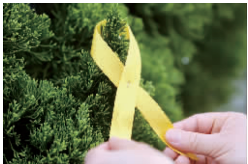
寄托悼念之情的黄丝带