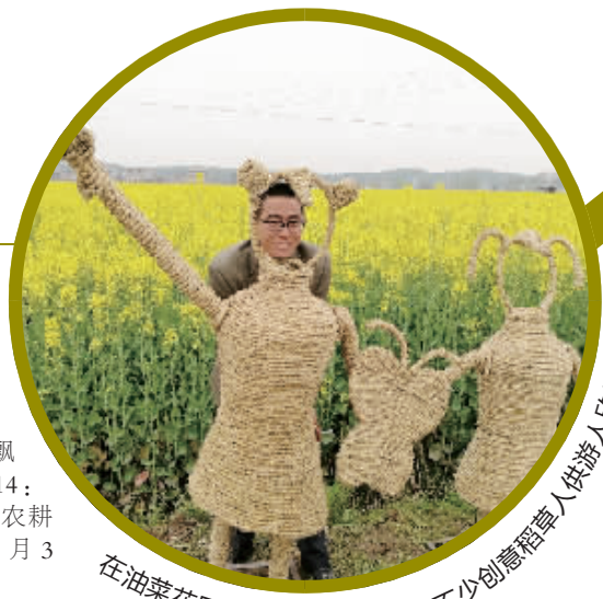
在油菜花田,节会主办方还摆了不少创意稻草人供游人欣赏、拍照

时间: 3月3日—5日 地点: 泉湖镇红湖村 活动主题: 十里花海,金色泉湖 活动内容: “春暖花开”摄影采风(3月3日);“诗韵飘香”飞花令比赛(3月5日14:30—15:30);旅游农产品展销、农耕文化展示和农家体验活动(3月3日—3月5日) 线路: 从衡阳市区出发,沿322国道经三塘、谭子山镇抵达泉湖镇后,在坐落于该镇的衡南四中即可看到醒目的油菜花海。