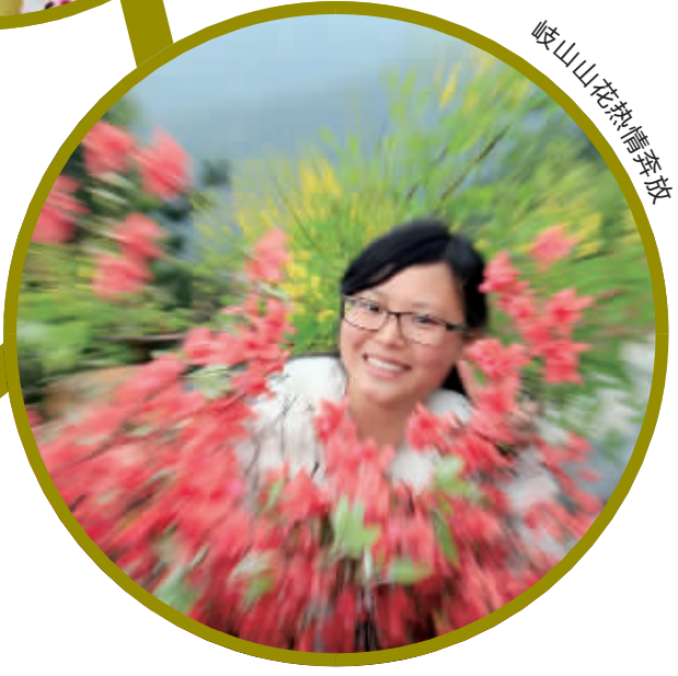
岐山山花热情奔放