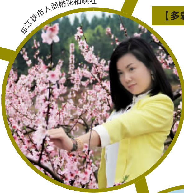
车江铁市人面桃花相映红