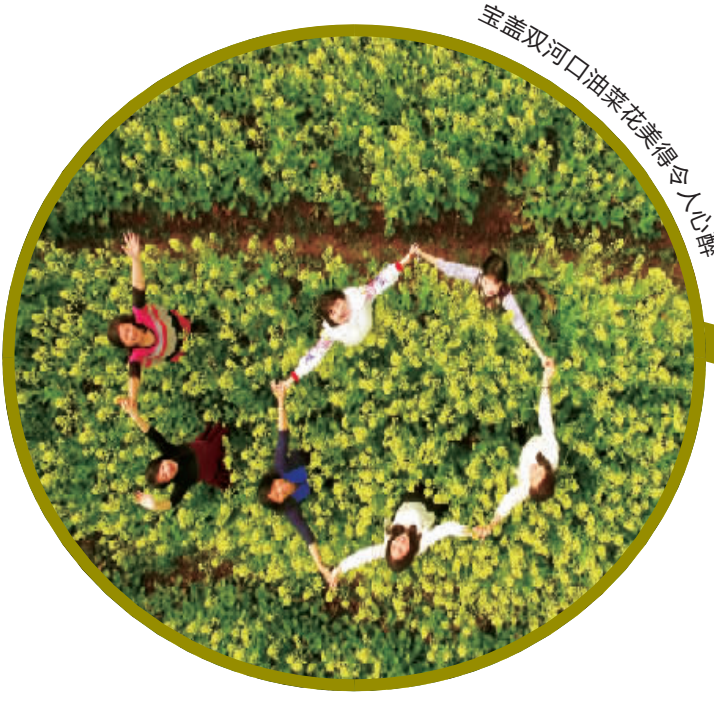
宝盖双河口油菜花美得令人心醉